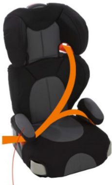
Sædepude med ryglæn

Sædepuden placeres på køretøjets sæde MJ-Easy Travel selen placeres omkring køretøjets sæde, og under køretøjets sikkerhedssele, som vist i afsnit 2.