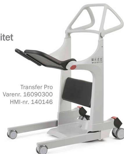
Transfer Pro Varenr. 16090300 HMI-nr. 140146

Maj og Ulrik er klar til at tilbyde en demonstration og vise, hvordan Transfer Pro kan gøre jeres hverdag nemmere.