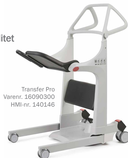
Transfer Pro Varenr. 16090300 HMI-nr. 140146

Maj og Ulrik er klar til at tilbyde en demonstration og vise, hvordan Transfer Pro kan gøre jeres hverdag nemmere.